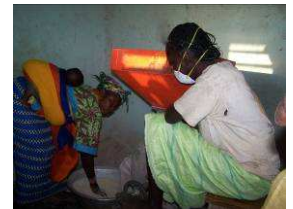
Meunières au travail

et qui a pu commencer à payer les annuités pour 2007. Nous avons donc ouvert un compte épargne à la poste de Yako pour capitaliser ces remboursements, qui serviront dans un avenir proche à financer tout ou partie de nouveaux projets de développement artisanal dans le village.