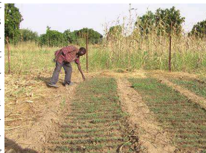
Jardin de Youzondo

L'ass. Youzondo de Bordeaux a financé à Petit Samba un jardin potager d'environ un demi hectare, fermé par un treillis métallique. Elle a fait creuser deux puits à 20 m de profondeur, et qui seront encore amenés à 25 m lors de la baisse du niveau des puits. On assure donc un arrosage tout au long de l'année. Les parcelles de ce jardin seront attribuées aux représentants Youzondo de chaque quartier (2 par quartier) du village. Il est prévu de creuser encore d'autres puits