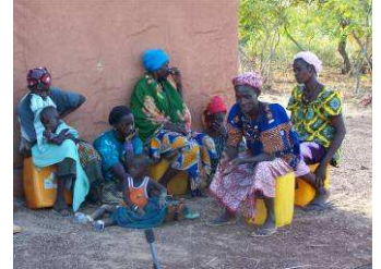
Palabre avec les femmes de la savonnerie

vente du savon stagnent. Afin de les aider à démarrer une production de masse, nous avons décidé de mettre à leur disposition un montant de 300'000 CFA (800.-CHF) pour acquérir un stock de matières premières. Nous leur proposons encore de financer une formation pour la fabrication de beurre de karité avec utilisation d'une baratte et d'un broyeur à noix de karité. La saison du karité commençant au mois de juin, elles ont le temps de réfléchir et de prendre une décision. L'AG de