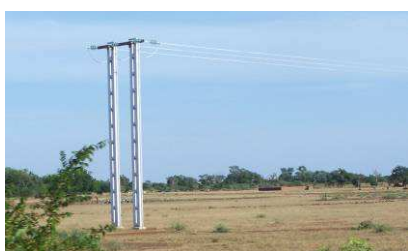
Ligne 33 kV passant à Petit Samba

dans ce jardin, on peut aussi penser monter un petit château d'eau... à suivre !