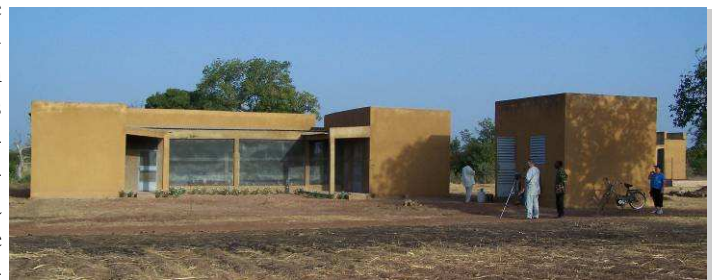
Le poulailler de Petit Samba en novembre 2007

Encore un grand sujet de satisfaction pour la délégation de l'APS lors de son séjour à Petit Samba. Nous avons pu admirer l'agrandissement terminé du poulailler. Cette construction a été réalisée en respectant le budget attribué et conformément aux instructions données. Il est totalement protégé contre les attaques extérieures telles que serpents, introduction de petits volatiles ou autres animaux pouvant amener des maladies. Nous avons aussi pensé à la grippe aviaire, le poulailler est entièrement couvert, y compris la zone « préau » et toutes les issues sont protégées par du treillis moustiquaire. Actuelle-