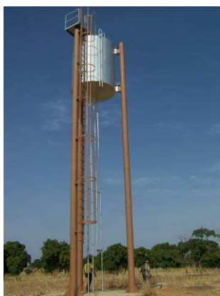
Le château d'eau de Kizambo

Il a été construit dans le quartier de Kizambo un grand château d'eau (15m3) en 2006 La distribution d'eau devrait se faire par des bornes équipées de robinets (déjà installées), situées à quelques centaines de mètres du réservoir. Cette magnifique réalis-