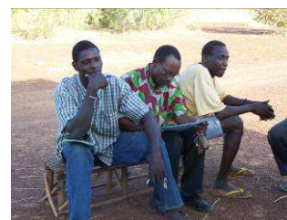
Rendez-vous avec le Groupement des Jeunes

investissements ainsi qu'un calcul de rentabilité et un calendrier de remboursement. Nous voulons savoir quel serait le bénéfice pour le village après remboursement de la dette. L'assemblée générale décidera ensuite de l'entrée en matière. L'investissement total pourrait être de l'ordre de 4 à 5 millions de CFA (8'000 à 10'000.- CHF)